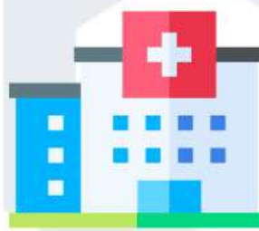
ЦЕНТРЫ СЕМЕЙНОГО ЗДОРОВЬЯ (ЦЕНТРЫ ПМСП)