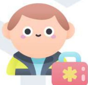
ФЕЛЬДШЕРСКО- АКУШЕРСКИЕ ПУНКТЫ